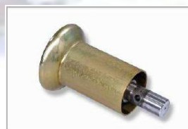
Rolna pro bezdušové pneu