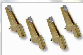
Rozšiřovací adaptéry do 60"