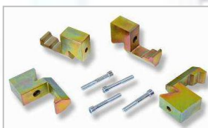
Adaptéry pro ráfky s velkou tloušťkou stěny