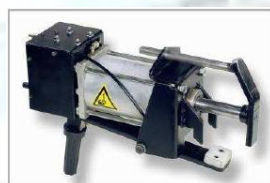
SPT 9 Pneumatický stlačovač