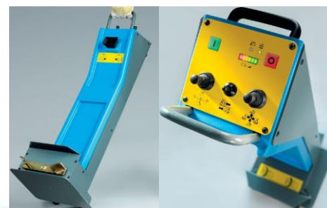
Dálkové radiové ovládání Jumbo TCS 56 R