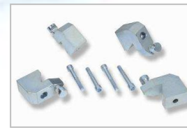
Adaptéry pro středové otvory od 80 mm